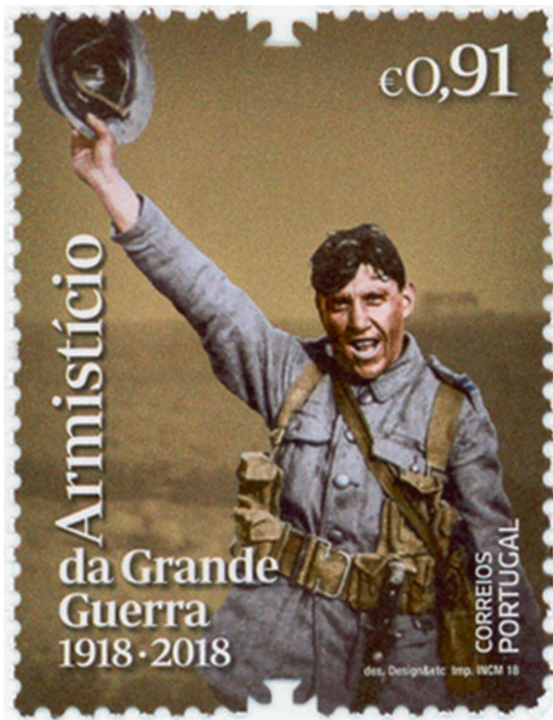
Selo emitido pelos CTT-Correios de Portugal para comemorar o Centenário do Armistício da Grande Guerra.