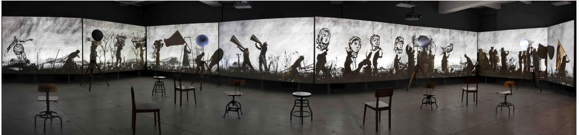
William KENTRIDGE, More Sweetly Play the Dance (Jouer la danse plus doucement) , 2015, dimensions variables, installation vidéo 8 canaux haute définition, 15 min, avec 4 porte-voix. Musée des beaux-arts du Canada, Ottawa, Canada. Vue d'installation à la galerie Marian Goodman, New York, 2016, États-Unis.