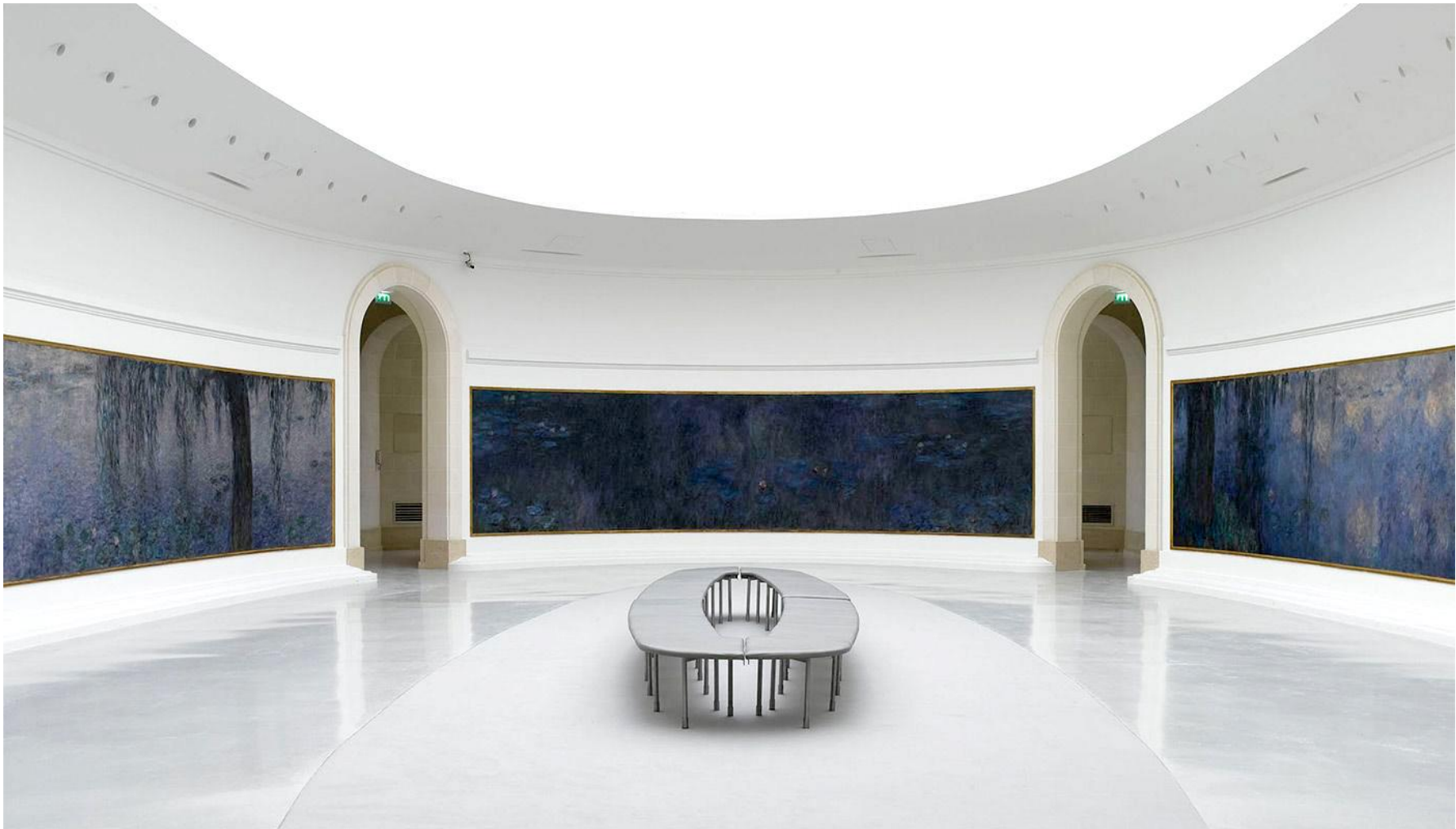
Claude MONET, Cycle des Nymphéas du musée de l'Orangerie , entre 1897 et 1926, huile sur toile, H : 1,97 m, L : environ 100 m linéaires, surface environ 200 m 2 . Musée de l'Orangerie, Paris, France.