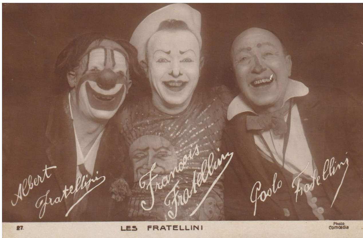
Les Fratellini, carte postale n°27, édition Comoedia, début XX e siècle, collection privée.