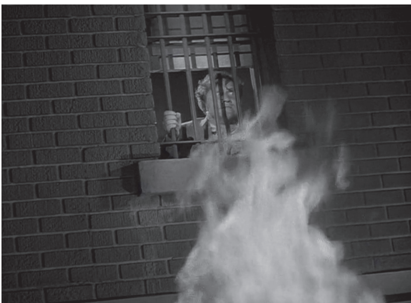
Photogrammes tirés de films de Fritz Lang. Dans l'ordre : M Le maudit (1931), L'In vraisemblable vérité (1956), Furie (1936)