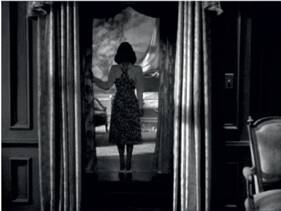
Fritz Lang, Le Secret derrière la porte , 1947, photogrammes du film.