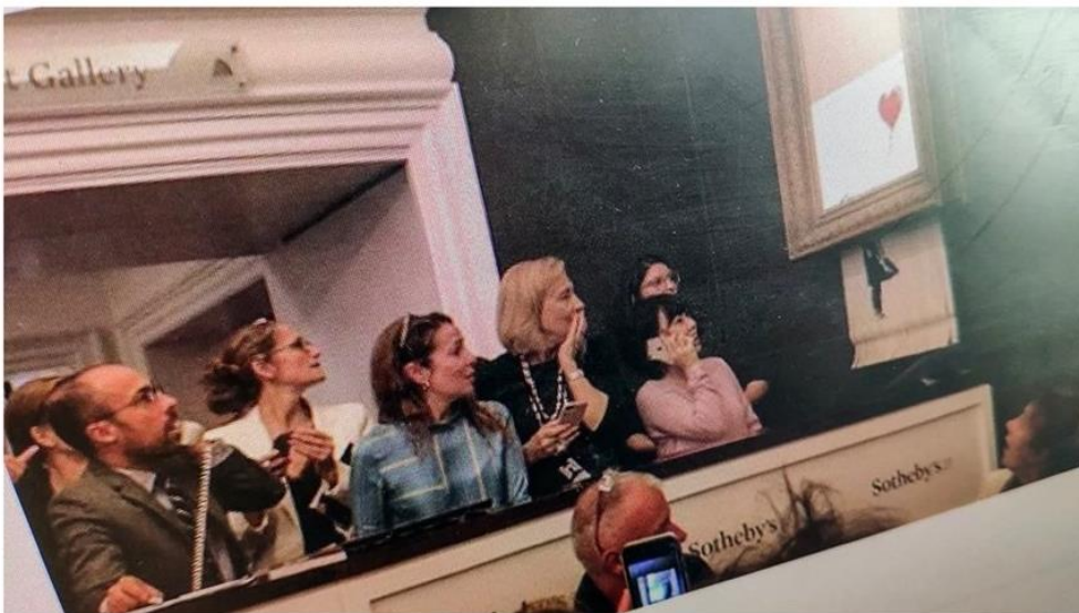
Image du compte Instagram de Banksy montrant la destruction d'une de ses oeuvres lors d'une vente aux enchères à Londres, le 5 octobre dernier.

CHRONIQUE. L'artiste Banksy a sans doute voulu dénoncer les excès de l'argent avec son tableau autodéchirant. C'est raté : ledit tableau vaut encore plus cher. Mais son message le plus important est ailleurs.