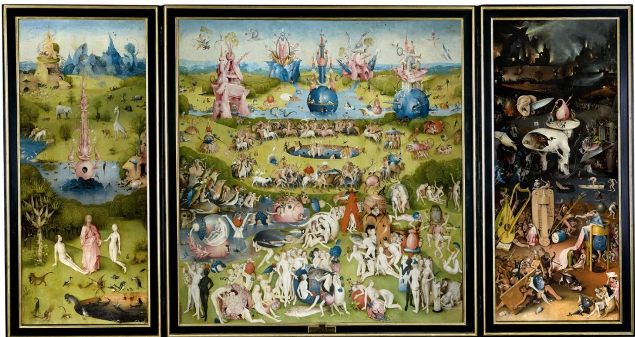
Jérôme BOSCH, Le Jardin des délices , 1494-1505, panneau central : 185,8 x 172,5 cm, panneaux latéraux : 185,5 x 76,5 cm chaque, huile sur bois. Musée du Prado, Madrid, Espagne.

Image supérieure : La Création du monde , triptyque fermé.