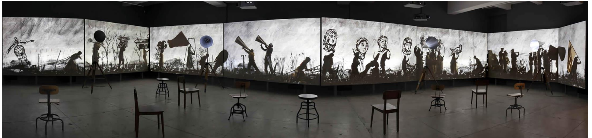
William KENTRIDGE, More Sweetly Play the Dance (Jouer la danse plus doucement) , 2015, dimensions variables, installation vidéo 8 canaux haute définition, 15 min, avec 4 porte-voix. Musée des beaux-arts du Canada, Ottawa, Canada. Vue d'installation à la galerie Marian Goodman, New York, 2016, États-Unis.