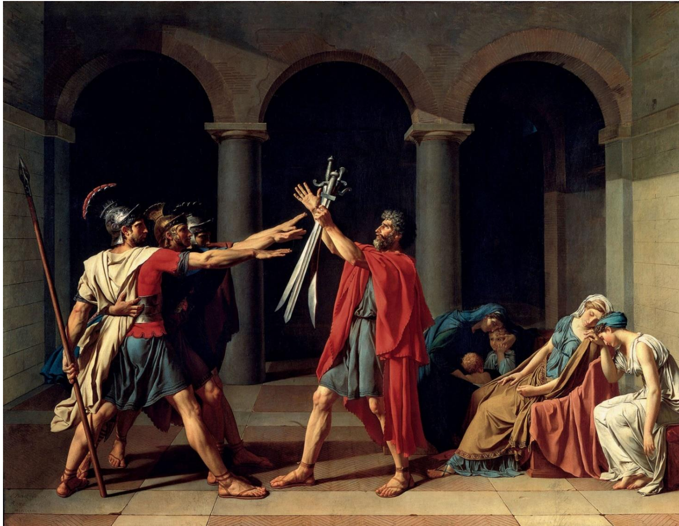
Jacques-Louis DAVID, Le Serment des Horaces , 1784, huile sur toile, 3,85 x 4,25 m. Musée du Louvre, Paris, France.

Le tableau présente les Horaces , héros de la Rome Antique, prêtant serment avant d'aller combattre.